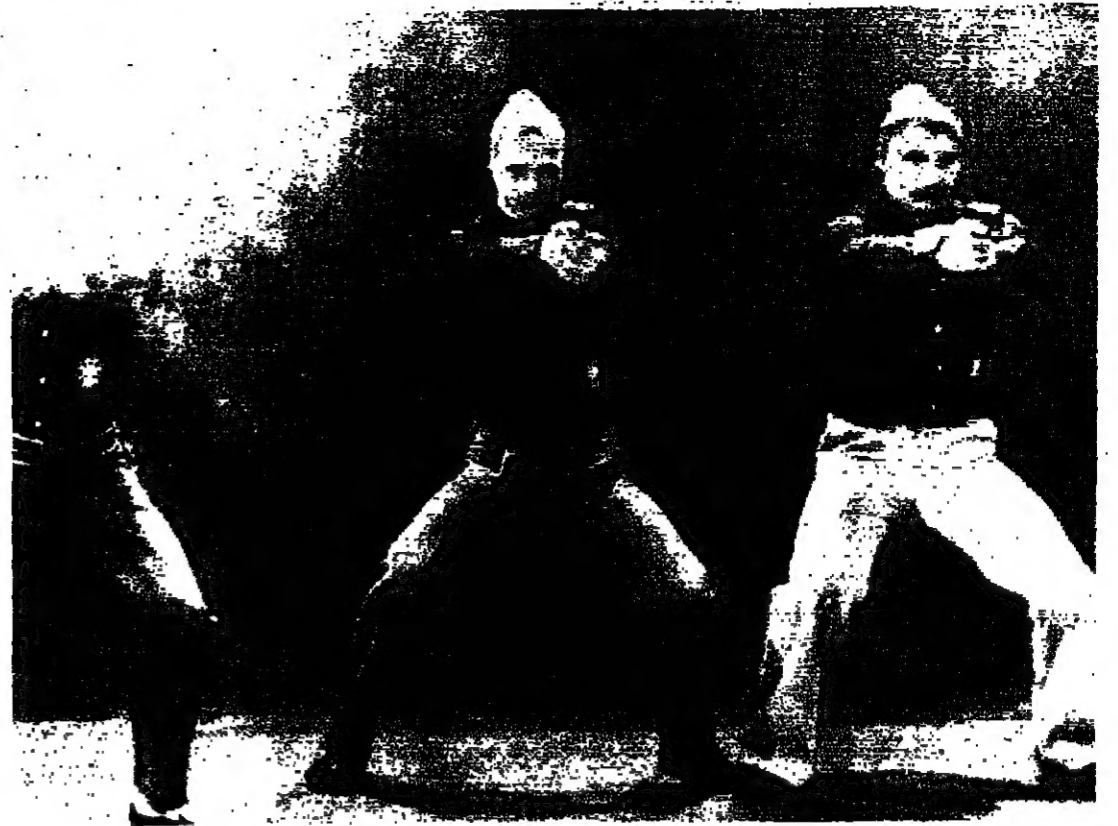
تدريب على إطلاق القنابل